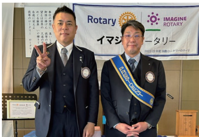
1月会員誕生日 三須会員